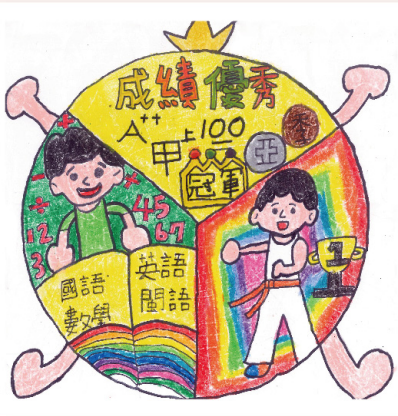
第三名 二乙 張凱晞