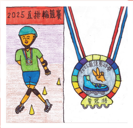
第三名 二庚 曾冠濤