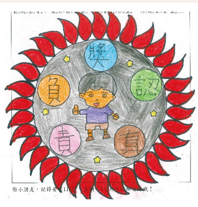
第三名 一丙 蕭寸登