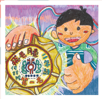
第三名 二乙 何喆裕