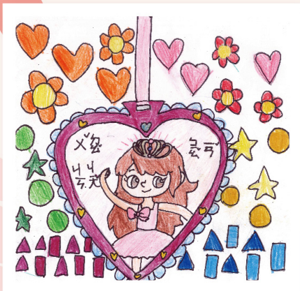
第三名 一乙 楊芷唯