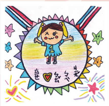
第三名 一甲 劉珉菲