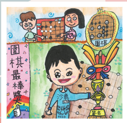
第一名 二丙 施有騰