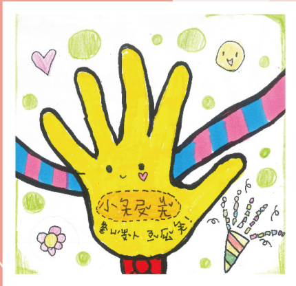
第一名 一丁 陳宇彤